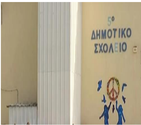
Φωτογραφία του 5 ου Δημοτικού Σχολείου Σερρών

Αγαπητοί μας μαθητές, αγαπητές μαθήτριες. Στα χέρια σας κρατάτε από σήμερα την εφημερίδα του σχολείου μας. Τη δική σας εφημερίδα. Θα προσπαθήσουμε κάθε μήνα να εκδίδεται και να παραδίδεται στο ηλεκτρονικό ταχυδρομείο σας, ώστε να την διαβάζετε μαζί με τους γονείς, τους φίλους, τους συγγενείς σας. Σκοπός της εφημερίδας αυτής, εκτός φυσικά από το να κοινοποιεί τα νέα του σχολείου μας, είναι να γνωστοποιεί επιτυχίες των μαθητών μας, ακόμη και σε εξωσχολικές δράσεις και γενικά να διαφημίζει καλές πρακτικές και συμπεριφορές ώστε να αποτελέσουν παραδείγματα προς μίμηση. Επίσης να μας ψυχαγωγεί, να μας μορφώνει και να μας προβληματίζει. Μπορείτε να στέλνετε τα κείμενα τις φωτογραφίες σας, ανέκδοτα,