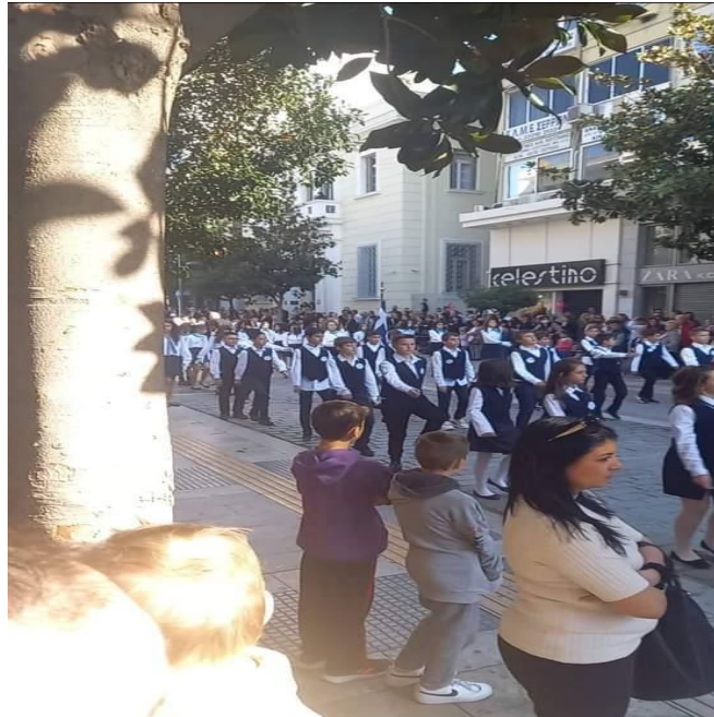
Εξαιρετική η εμφάνιση του σχολείου.