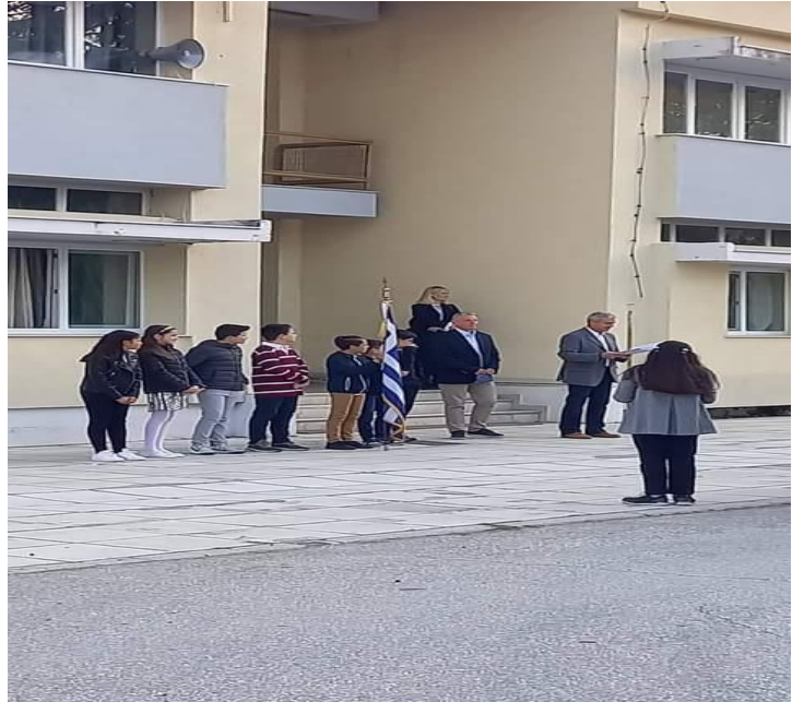
Παράδοση σημαίας στους μαθητές της Στ' τάξης